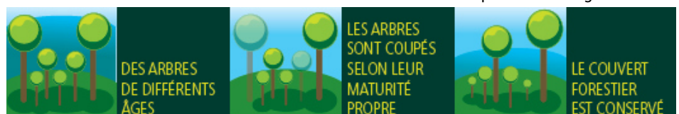
Illustration d'une coupe en futaie irrégulière

Contact ONF agence Séverine Rouet severine.rouet@onf.fr