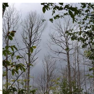
Image d'un frêne atteint de la Chararose